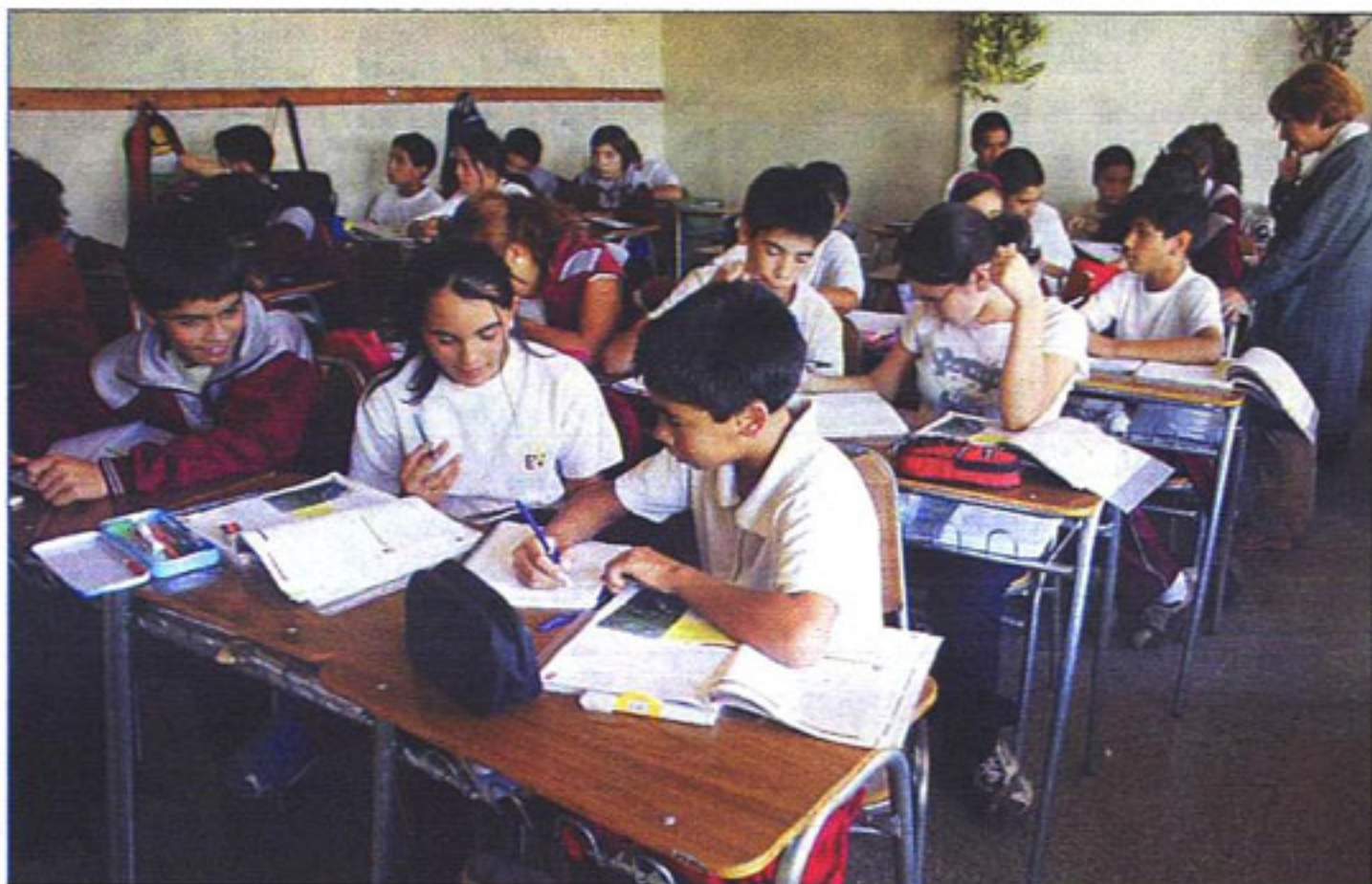
Bachelet señaló que la calidad de la educación estará garantizada por tres pilares: un nuevo marco regulatorio, la creación de una Superintendencia y un nuevo esfuerzo financiero.

INVERSIÓN LLEGARÁ A 5 MIL MILLONES DE DÓLARES EN 2008